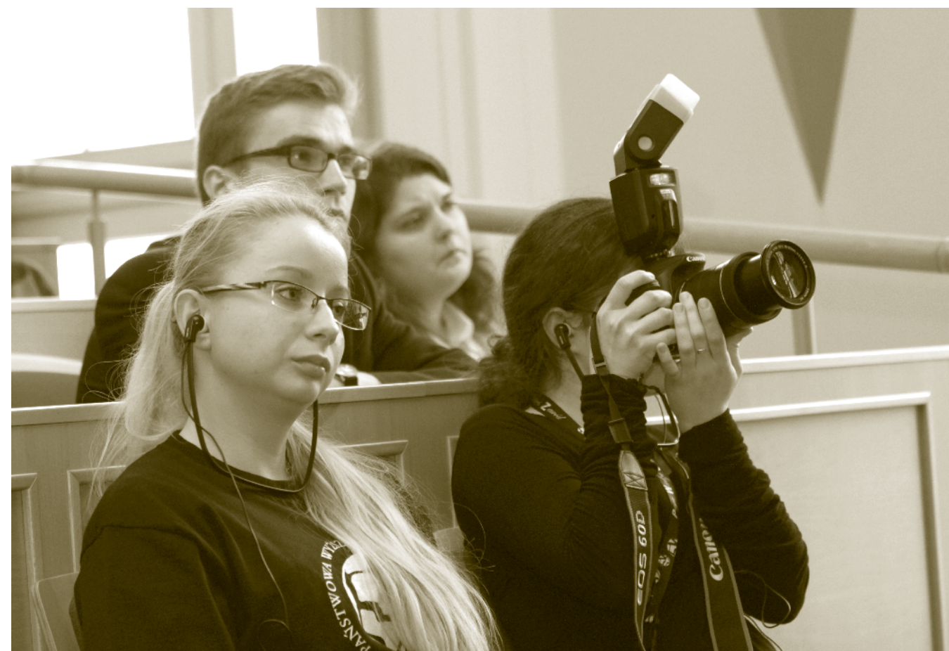
Fotoreporterki z FOTONU