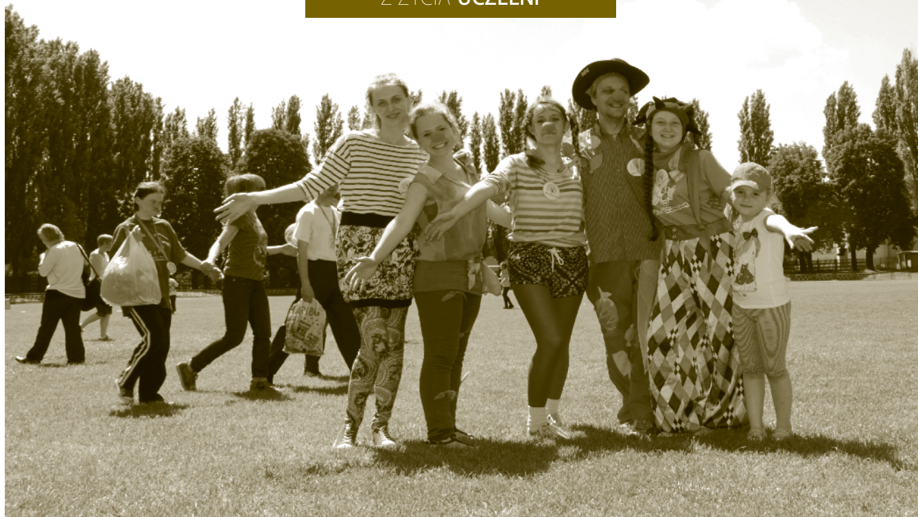
W igrzyskach jak zawsze aktywnie uczestniczyli studenci-wolontariusze, m.in. z Fundacji Dr Clowna