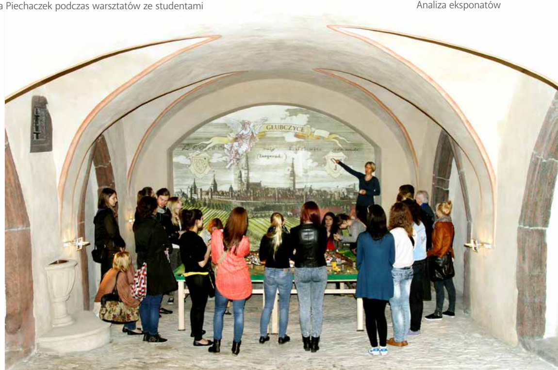
W Muzeum Ziemi Głubczyckiej

Wyrażamy życzenie poprawy tego wyniku w przyszłym roku!