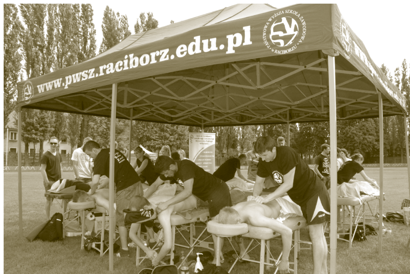
Dla zmęczonych oferta masażu