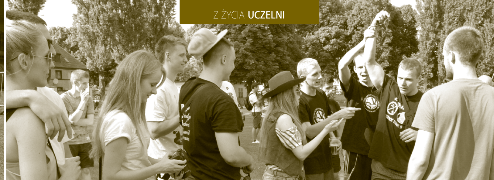
Za czym kolejka ta stoi?