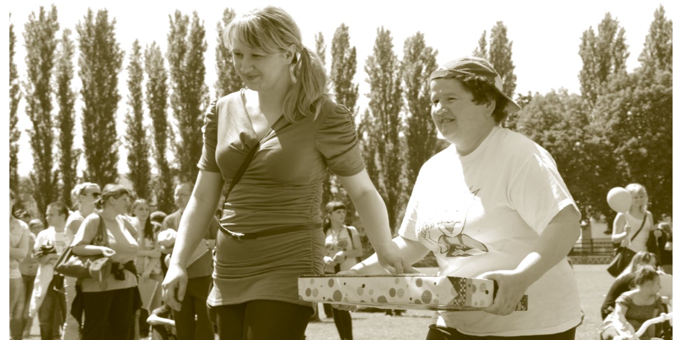
Impreza posiada cenne walory integracyjne