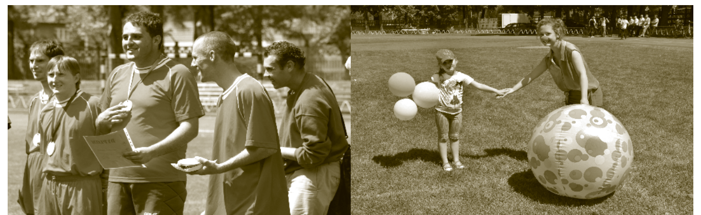
Zwycięzcami byli wszyscy