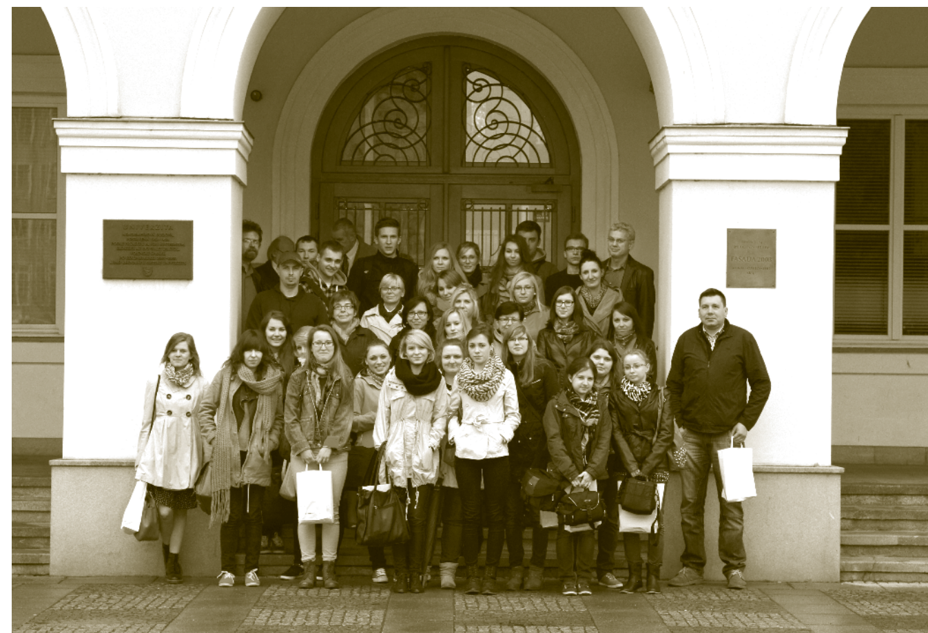
Pamiątkowe zdjęcie uczestników konferencji