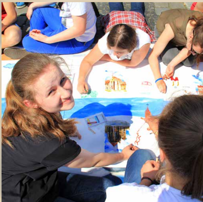
Sztuka niesie radość