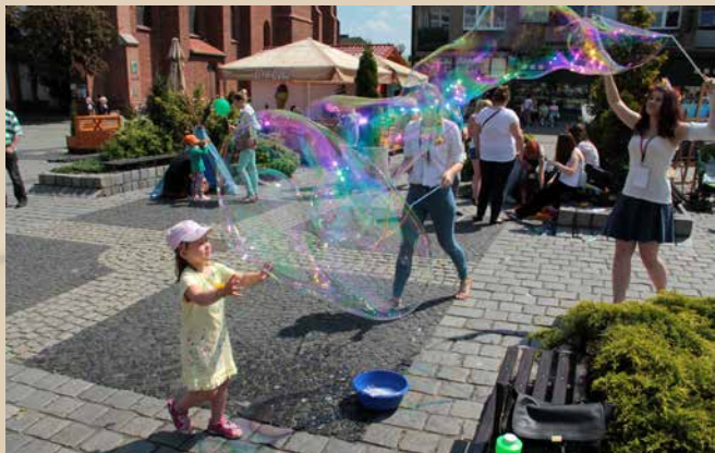
Sztuka i zabawa