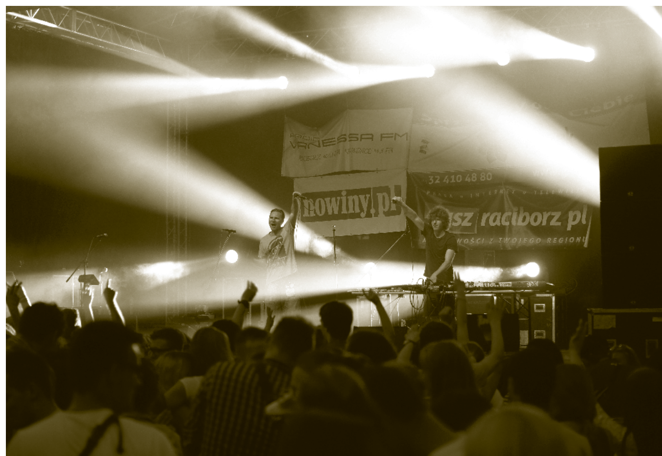
Klimat nocnego koncertu