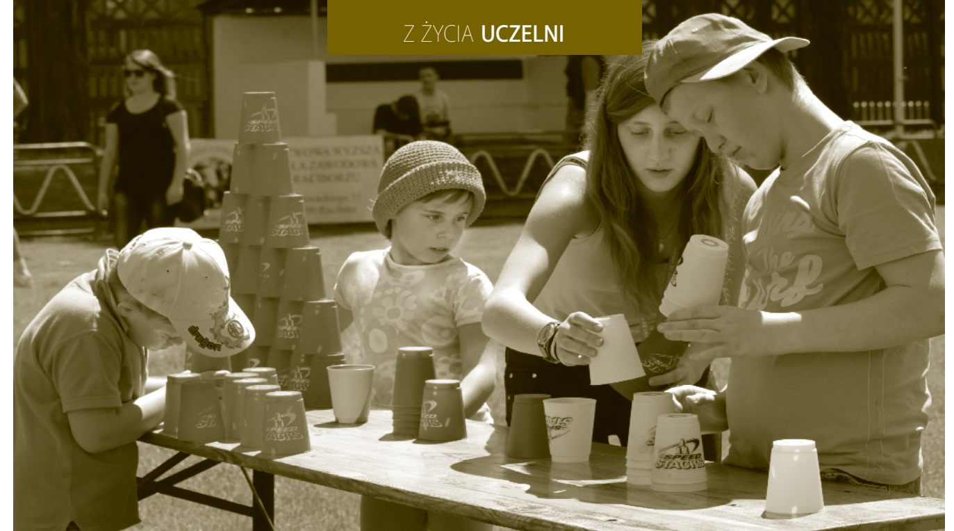
W igrzyskach biorą udział osoby należące do różnych kategorii wiekowych